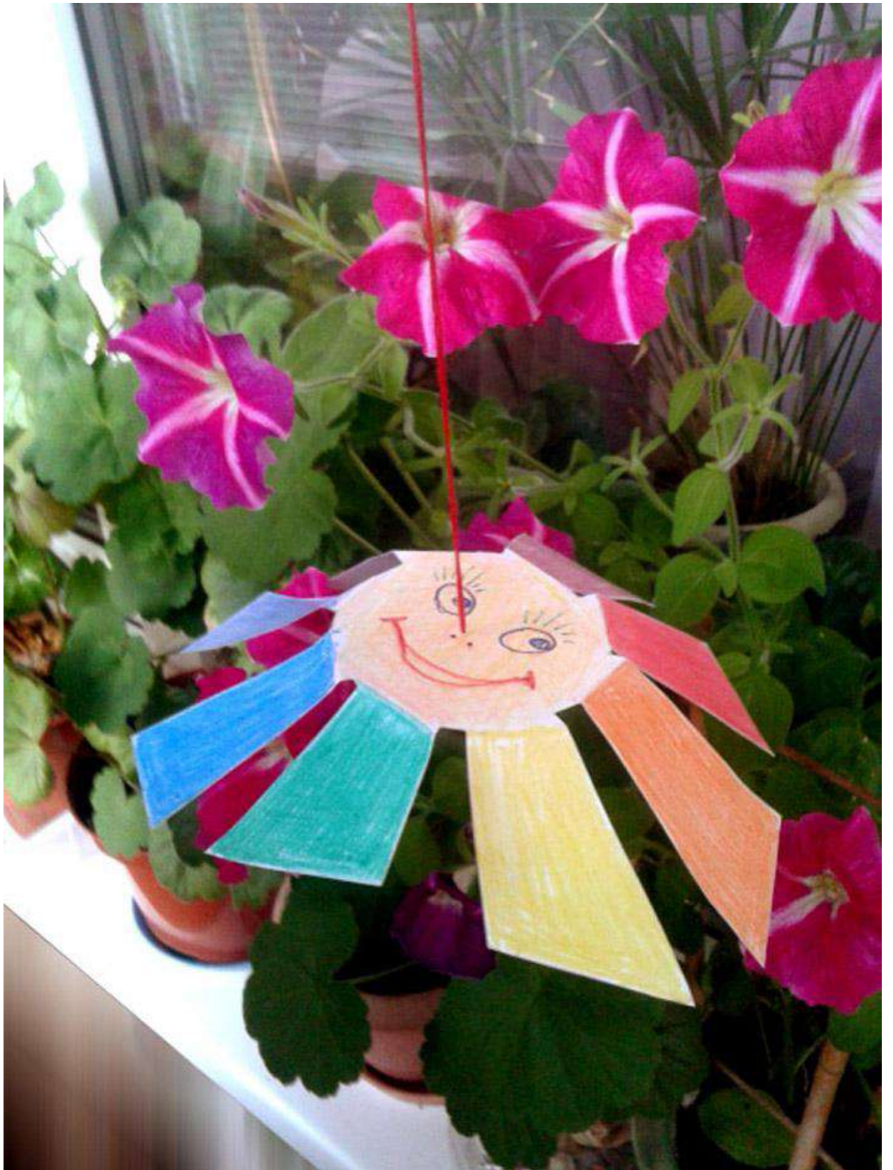
Рис. 3. Прокалываем в центре дырочку и пропускаем нитку (примерно 50 см.), завязываем нитку с тыльной стороны большим узлом. Солнышко готово! С ним можно играть дома и на прогулке.