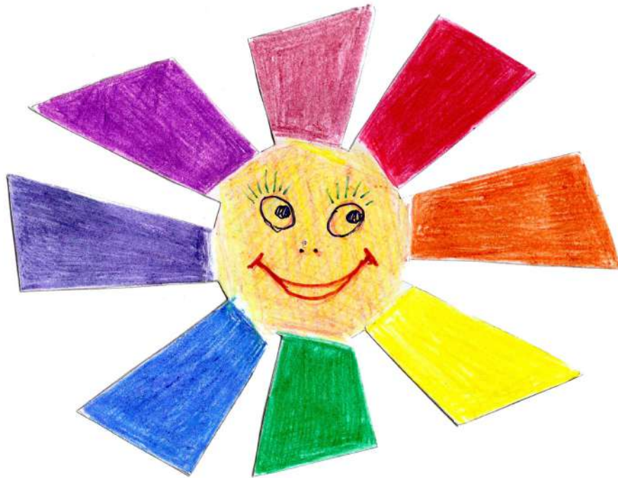
Рис. 2. Раскрашиваем Солнышко и его лучики цветными карандашами. Рисуем весёлое личико! Вырезаем изделие по контуру, сгибаем лучики строго по пунктирным линиям.